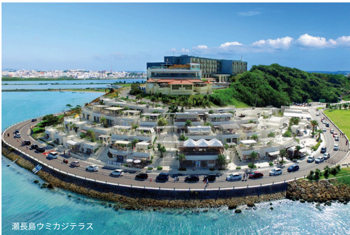
瀬長島ウミカジテラス